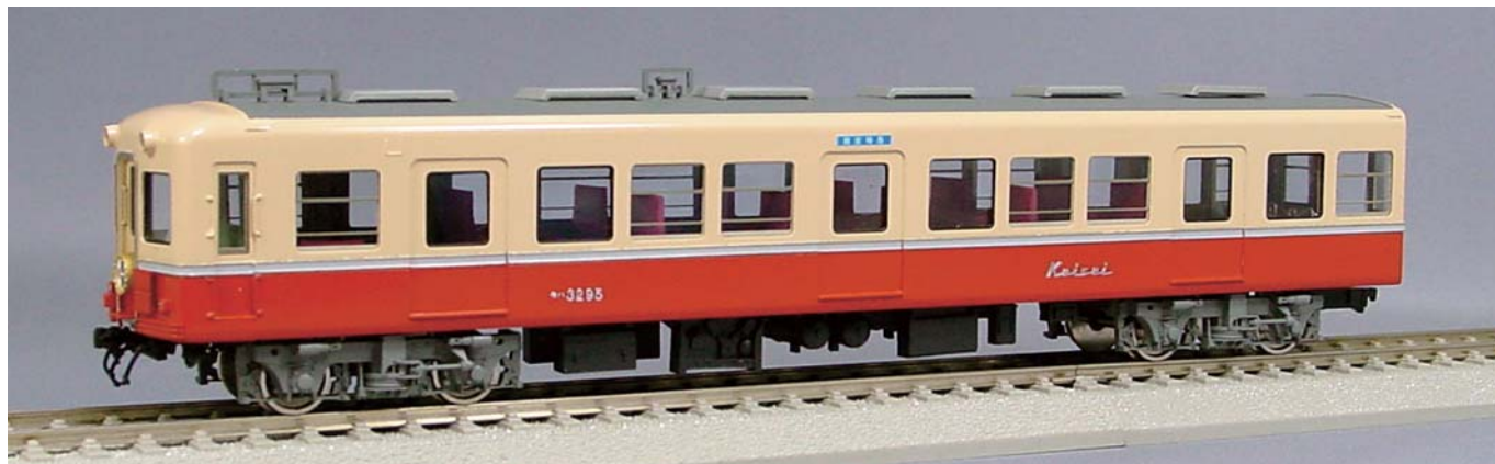
写真は試作品です

京成電鉄3200形のうち、特急「開運」号用に製作されたのが90番代です。片開きドア、セミクロスシート等が特徴でした。晩年は「開運」号の任をスカイライナーAE1に譲り、通勤車改造を施され活躍しました。今回、「開運号」と「通勤改造後」の両タイプを再生産いたします。