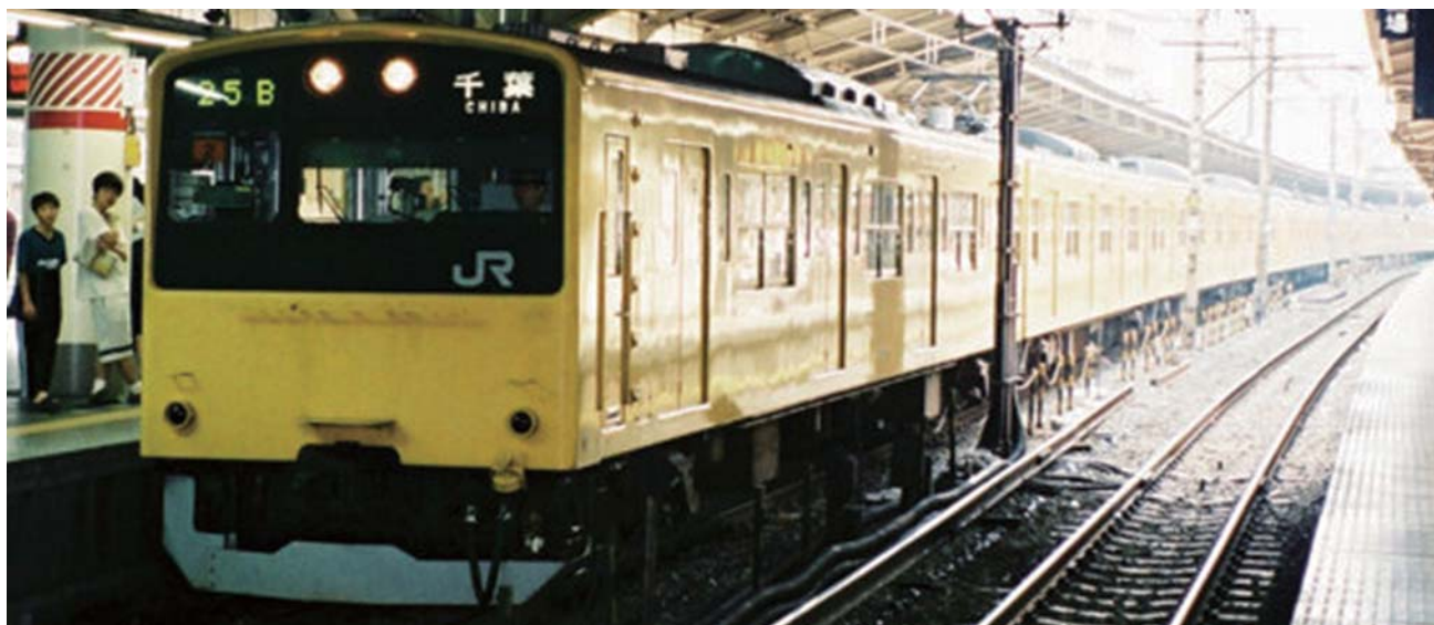
参考写真です。写真の車輛は900番代ではありません。

通常販売に加え、モデルプラザ・エンドウ限定で①201系中央快速色の電幕点灯仕様の両先頭車セット、②試作車900番代黄色塗装を設定しました。